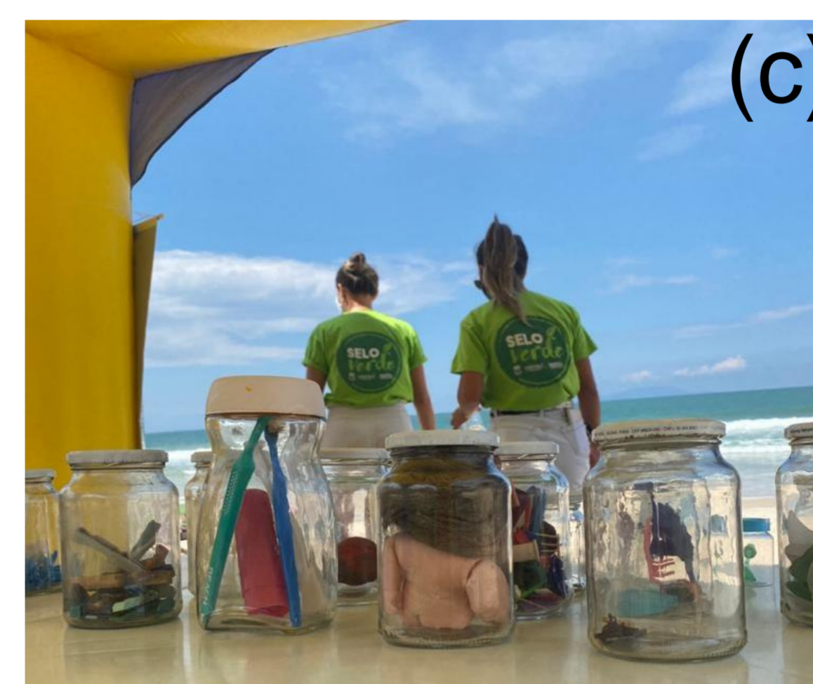
Fig. 1: (a) COLIXO – GCR exposta na Escola do Meio Ambiente; (b) COLIXO-GCR virtual; (c) Atividade de Educação Ambiental com público alvo os usuários da praia.

Devido ao distanciamento social decorrente da pandemia COVID-19 e à intensificação do uso de meios digitais para comunicação, foi criada uma versão em ambiente virtual, através da rede social Instagram @ColixoGCR.